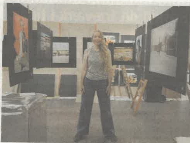
Thilde Jensen skriver sig ind i historien af danske fotodokumentarister, der har beskæftiget sig med undersiden af USA.