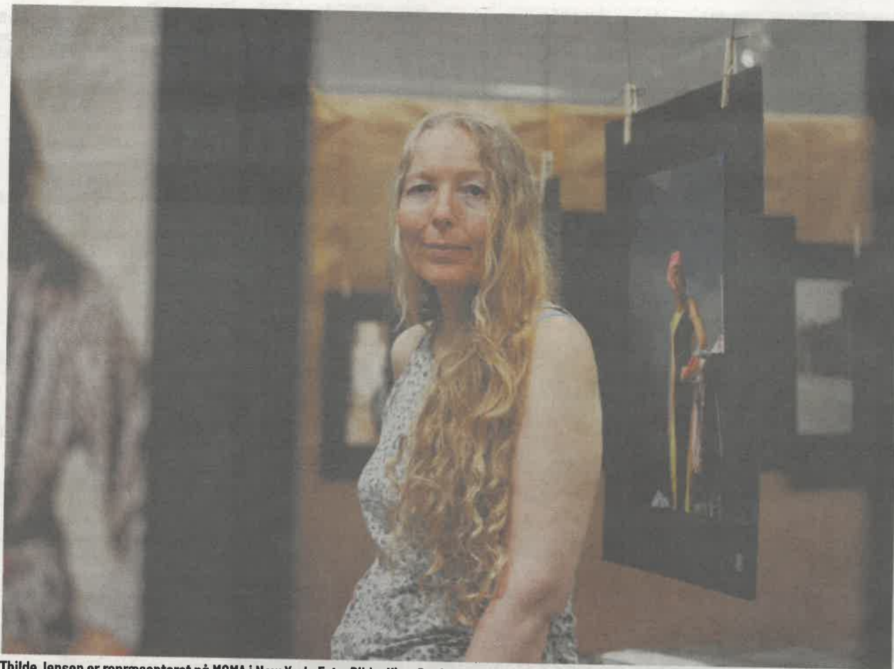
Thilde Jensen er repræsenteret på MOMA i New York.