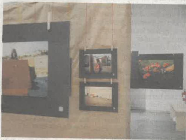
Udstillingen kan ses på Esbjerg Museum frem til udgangen af februar.

Thilde Jensen blev ramt af det, der har den kliniske betegnelse Environmental Illness. Uden at gå for meget i detaljer betyder det, at hun og andre som hende er hypersensitive overfor det moderne samfunds luftforurening. Det kan være alt fra udstødningsgas til parfume. Og kaster man så lige alle de elektroniske strålinger, der skærer sig gennem luften på kryds og tværs i form af kabler, mobiltelefoner og computere, med ind i puljen, så er